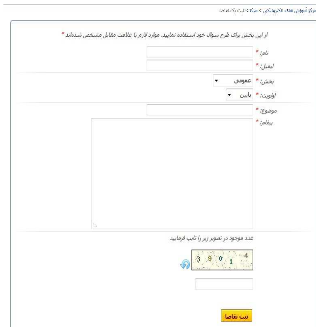
شکل ۳- صفحه ثبت تقاضا

نکته: زمانی مشکل شما مربوط به اطلاعات کاربری یا ورود به سیستم است اطلاعات خود را در متن پیام بفرستید تا مورد با سرعت بیشتری بررسی و پاسخ‌دهی گردد.