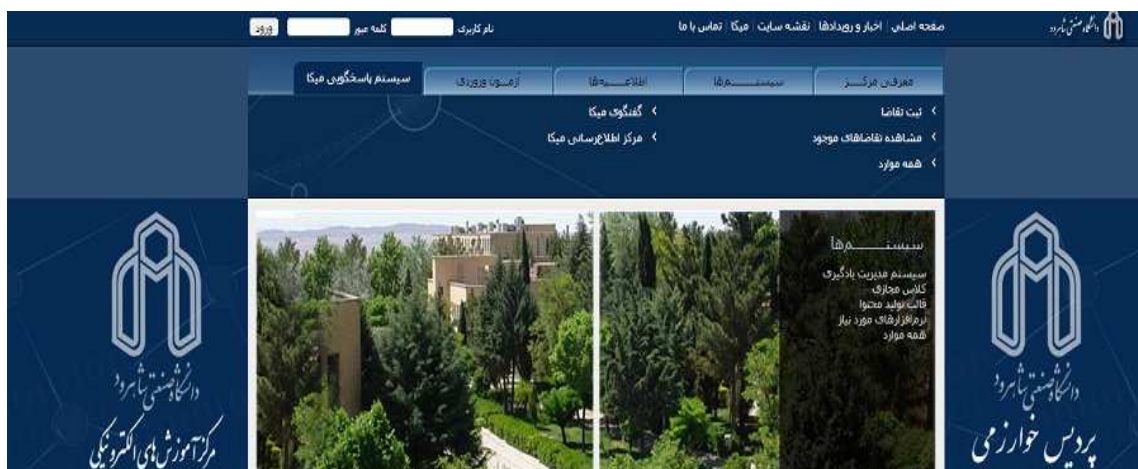
شکل ۱- ورود به سیستم پاسخگویی میکا

جهت استفاده از سیستم پاسخگویی میکا در صفحه اصلی سایت مرکز آموزش‌های الکترونیکی ( http://vu.shahroodut.ac.ir ) به قسمت سیستم پاسخگویی میکا بروید.