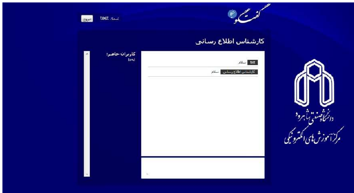
شکل ۷- گفتگوی میکا

در قسمت گفتگو شما می‌توانید یک نام وارد نمایید سپس به صفحه گفتگو وصل می‌شوید در این قسمت می‌توانید کسانی که آنلاین هستند را ببینید و با آنها به صورت آنلاین گفتگو نمایید.