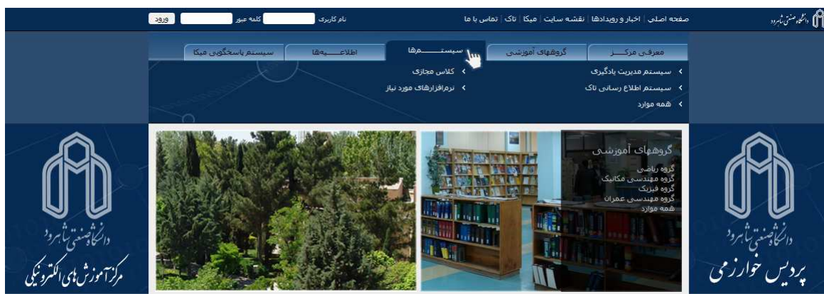
شکل ۱- ورود به سیستم اطلاع رسانی تاک

جهت استفاده از سیستم اطلاع رسانی تاک در صفحه اصلی سایت مرکز آموزش‌های الکترونیکی ( http://vu.shahroodut.ac.ir ) در منو سیستم‌ها به قسمت سیستم اطلاع رسانی تاک بروید.