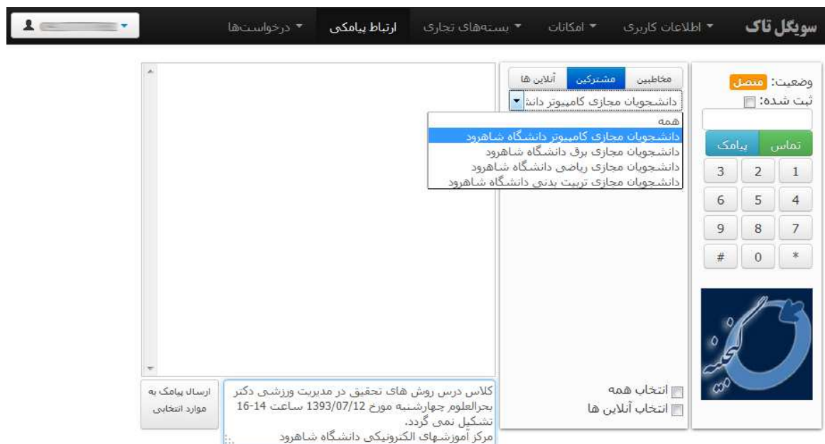
شکل ۵- ارسال و دریافت پیامهای اطلاع رسانی و ارتباط کاربران با یکدیگر

در نسخه وب سیستم اطلاع رسانی تاک می توان از طریق این گزینه پیامهای دریافتی را مشاهده و یا برای دوستان و مخاطبین خود پیام ارسال نمود. همچنین می توان برای مخاطبین مشترک خود در بسته های تجاری عضو شده که در قسمت قبل توضیح داده شد پیام به صورت گروهی و یا انفرادی ارسال کرد.