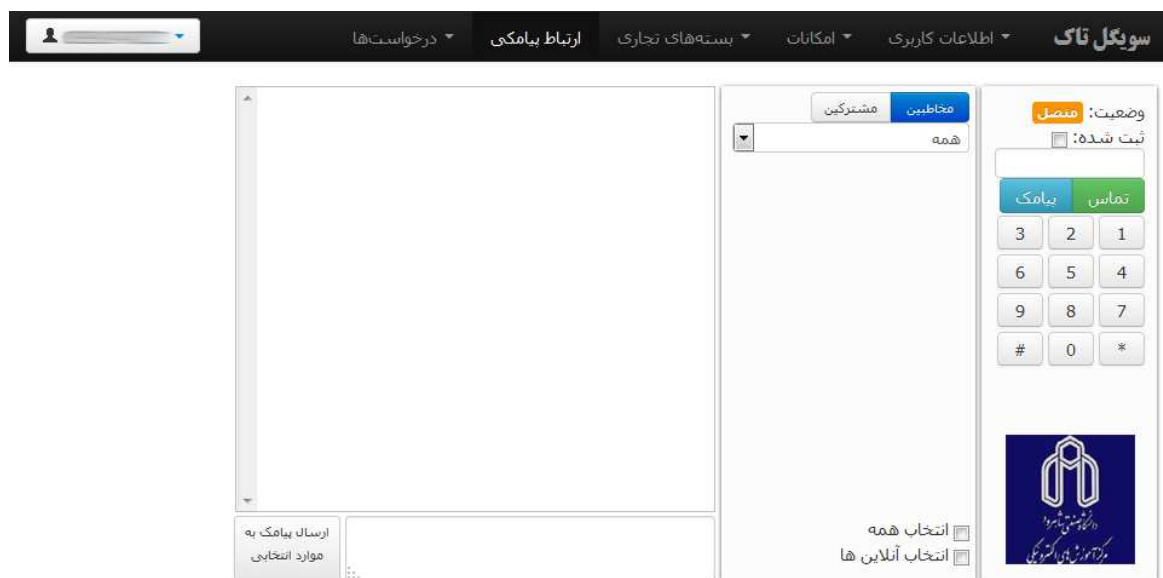
شکل ۲- صفحه اصلی سیستم تاک

سیستم تاک متشکل از چندین قسمت شامل: اطلاعات کاربری، امکانات، بسته های تجاری، ارتباط پیامکی و درخواست ها می باشد. که به توضیح هر یک از این بخش ها می پردازیم: